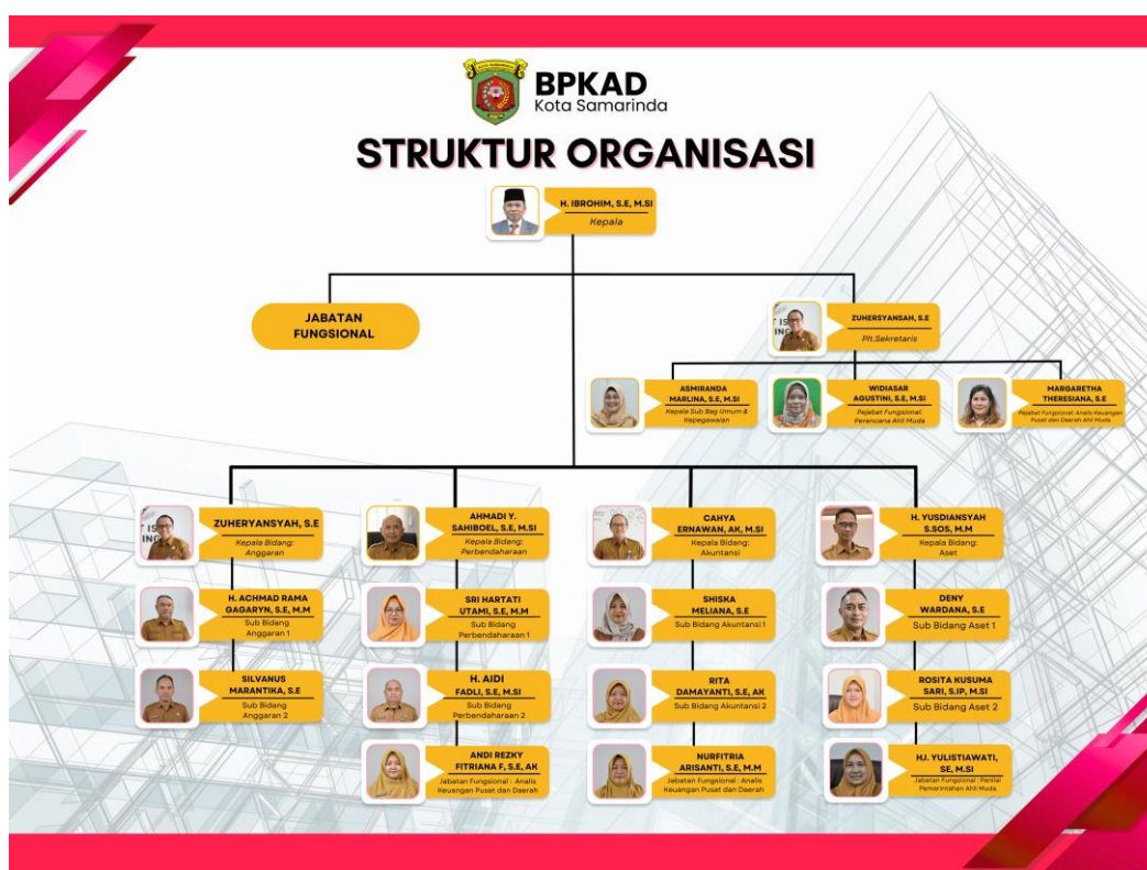
Tabel. 1.1 Struktur Organisasi

Sub.Bidang dan berdasarkan Permenpan RB Nomor 17 Tahun 2021 Tentang Penyetaraan Jabatan Administrasi ke Jabatan Fungsional terjadi beberapa penyetaraan pada jabatan administrasi ke jabatan fungsional sehingga terdapat 6 (enam) jabatan yang disetarakan yakni 2 (dua) Kasubbag dan 4 (empat) Kasubbid menjadi Jabatan Fungsional yang secara lengkap Struktur Organisasi pada BPKAD Kota Samarinda dapat dijelaskan pada tabel sebagai berikut :